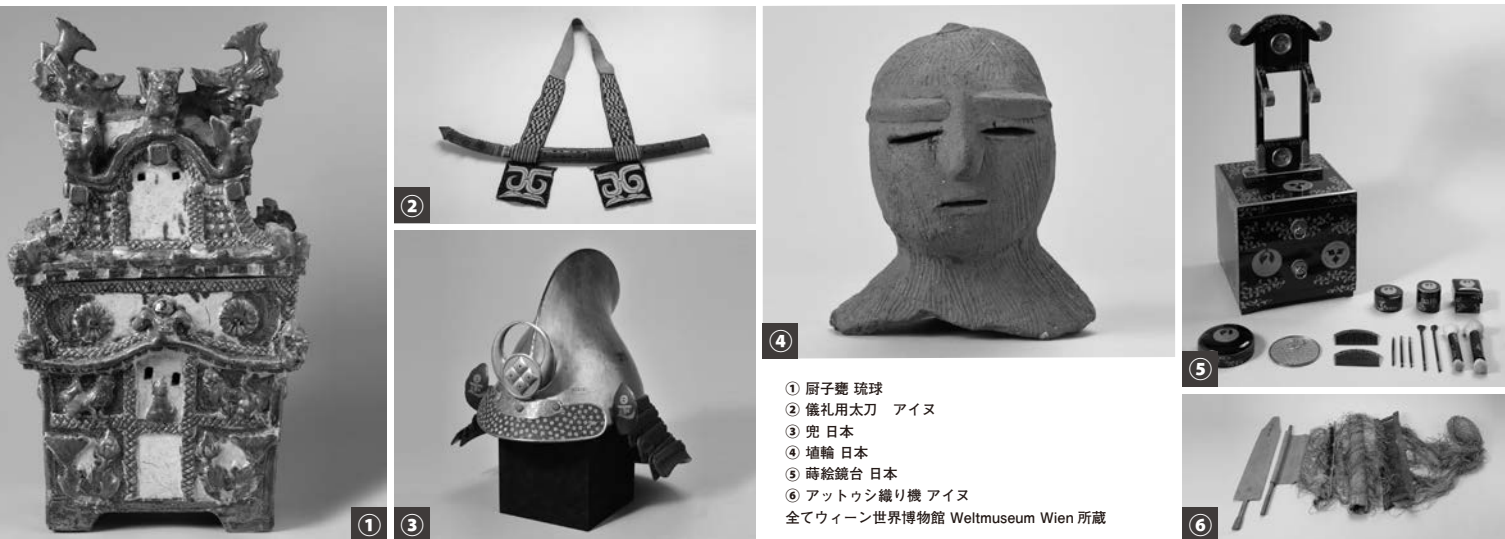
① 厨子臺 琉球 ② 儀礼用太刀 アイヌ ③ 兜 日本 ④ 埴輪 日本 ⑤ 蒔絵鏡台 日本 ⑥ アットウシ織り機 アイヌ 全てウィーン世界博物館 Weltmuseum Wien 所蔵

本シンポジウムでは、国立西洋美術館における「北斎とジャポニスム」展開催を機に、19世紀における日本コレクション形成の動向をたどりたいと思います。江戸時代後期から開国、さらにはジャポニスムの時代へと変化する19世紀の収集家とその周辺の人々に注目しつつ、彼らの個人的な視線はもとより、博覧会や博物館設立とコレクション形成との関連、貿易や産業振興などの側面にも留意しつつ、日本文化受容とその紹介の具体相に迫ります。あわせて在外日本関係資料の活用の現状と問題点についても、認識を深める機会にできればと思います。