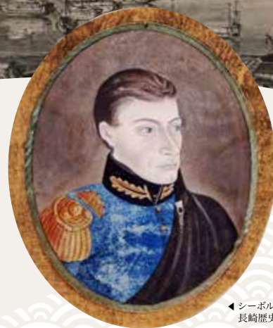
◀シーボルト肖像画