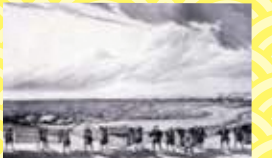
江戸参府のオランダ使節一行(シーボルト「日本」)